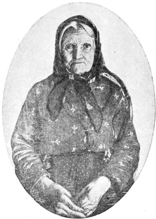
И. А. Федосова после выступления в Русском Географическом Обществе (Петербург, 1895 г.)